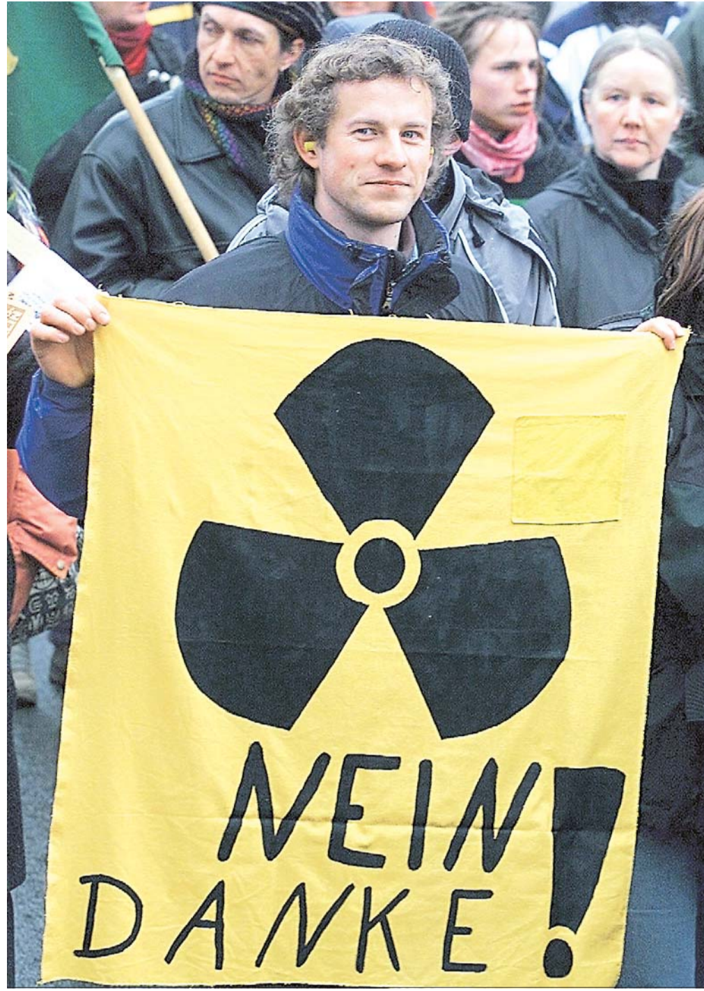
Die Mehrheit der Deutschen, das zeigen die Umfragen, will keinen Atomstrom. Doch dieselbe Mehrheit bezieht aus der Steckdose ebendieses. Das ist inkonsequent – und veränderbar.

Die Umweltbewegung hat angesichts der neuen Herausforderung erstaunlich wenig erreicht: es scheint als habe sie gerade in Ihrem eigenen Verantwortungsbereich, bei der Mobilisierung eben jener Konsumentenmacht, die den Atomausstieg per Konsumentenentscheidung zementieren könnte, kläglich versagt. Es ist nicht zu fassen: ein Volk von Atomskulpturen kauft im Jahre 2006 immer noch beinahe geschlossen bei Atomkonzernen und deren Töchterunternehmen.